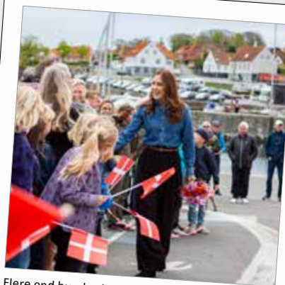
Flere end hundrede bornholmere var mødt op udenfor klinikken, og H.M. Dronningen tog sig god tid til at hilse på folk.

H.M. Dronning Mary har siden 2005 været protektor for Nyreforeningen.