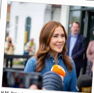
H.M. Dronningen udtalte sig til pressen efter besøget.