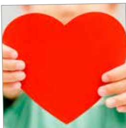
Støt et godt formål s. 10