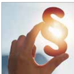
Udgifter og sygefravær s. 10