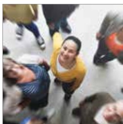
Hvem kan blive donor s. 4