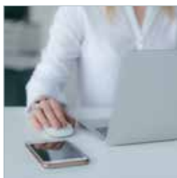
Mere information s. 22