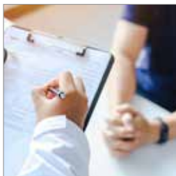
Hvem kan få en nyre? s. 4