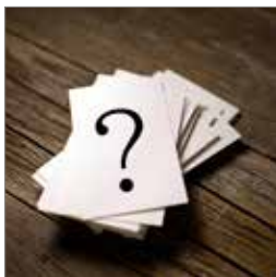
Måder du kan spørge s. 8