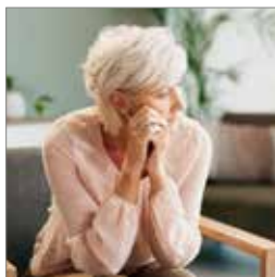
Frygten for at spørge s. 6