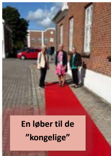
En løber til de "kongelige"

Efter maden blev der spillet op til dans, og stemningen var i top. Der var liv, glæde og masser af grin – præcis sådan, som et jubilæum skal fejres.