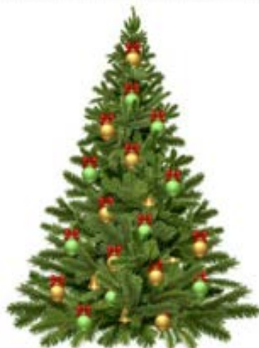
Vi ses til Nyreforeningens juletræ.

Den 1. søndag i Advent er det tid til Nyreforeningen Nordjyllands juletræsfest i Vejgaardhallen .