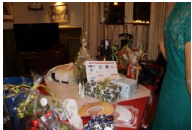
Minde fra 30 års jubilæet på Agerskov Kro