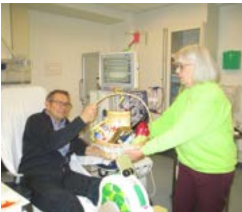
En heldig vinder ved Banko i dialysen