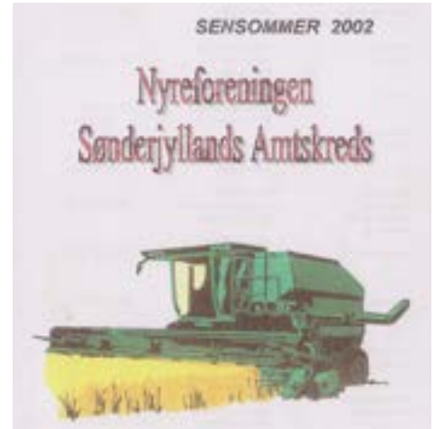
Et Kredsblad fra dengang

Der er allerede nedsat en arbejdsgruppe, som skal planlægge markeringen.