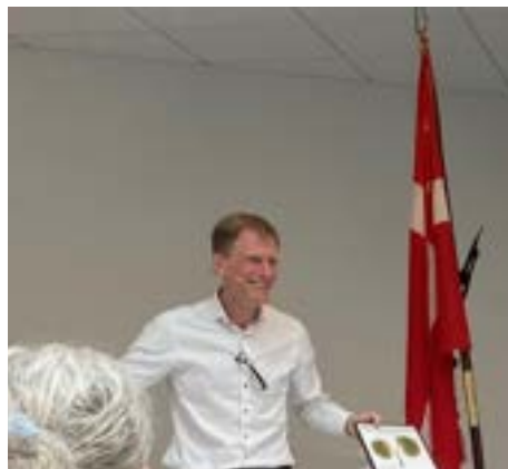
Prisoverrækkelse ved Landsmødet