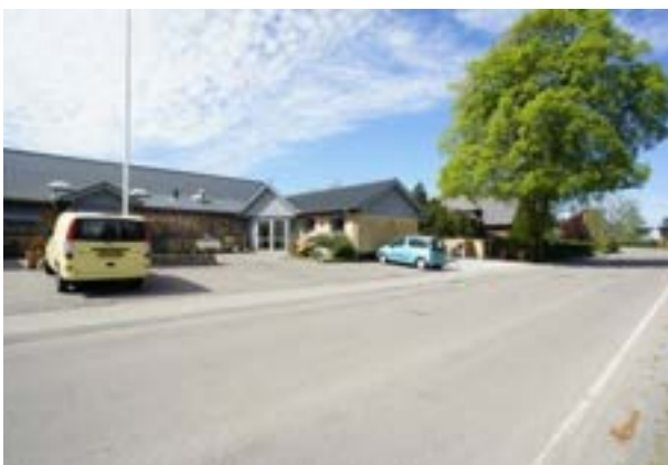
Holbøl Landbohjem, hvor festen holdes.