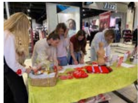
Organdonordag. Pigerne udfylder spørgeskema