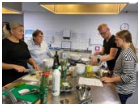
Vi lærte nye retter på madkurset