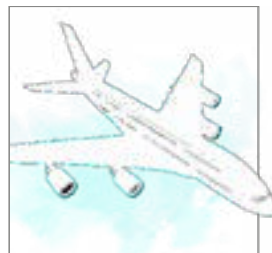
Behandling på ferien s. 7