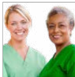
Dialyse i udlandet s. 8