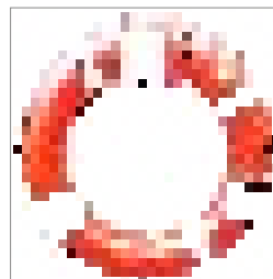
Forsikring s. 5

Pjecen her samler de væsentligste ting, du bør vide om medicin, dialyse, sygesikringskort og andet, du skal huske, når du rejser. Desuden har vi lavet en tjekliste, som du kan gennemgå, inden du tager af sted og en liste over nyttige hjemmesider, hvor du kan finde mere information.