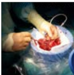
Transplantation s. 13