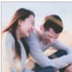
Hvem giver nyren? s. 8