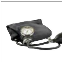
Pas på dig selv s. 20